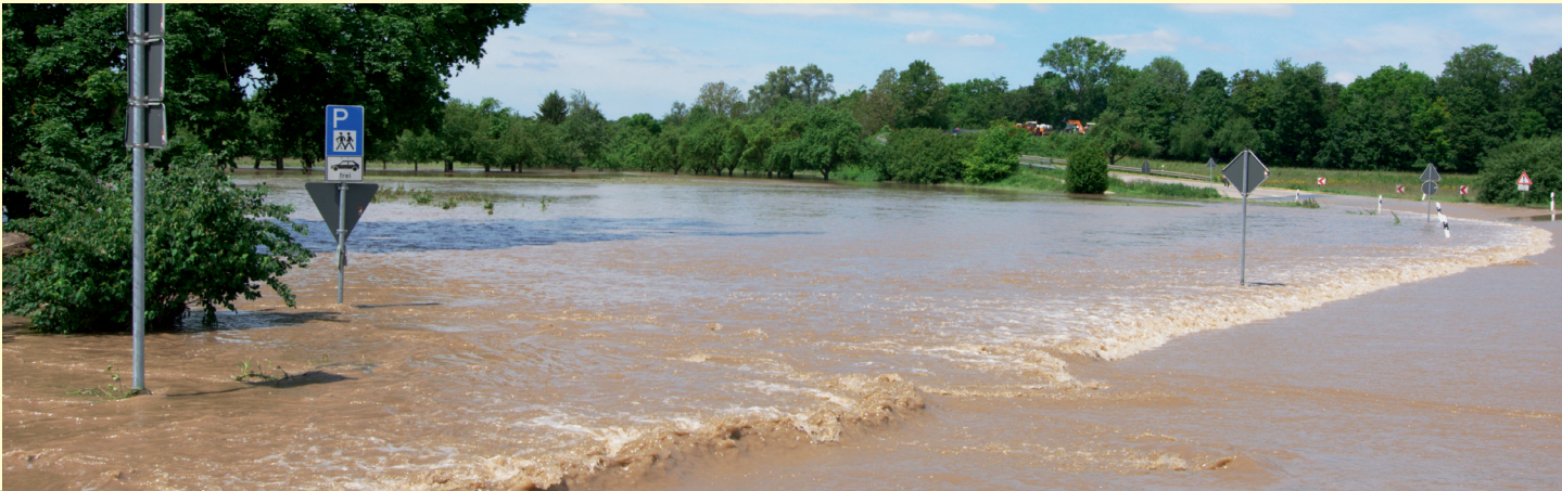
Neckarhochwasser 2013 bei Freiburg